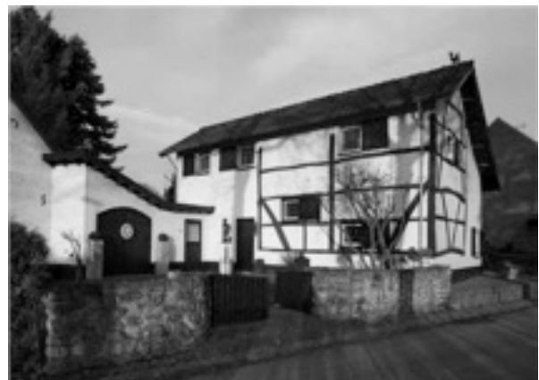
Typische Zuid-Limburgse huizen