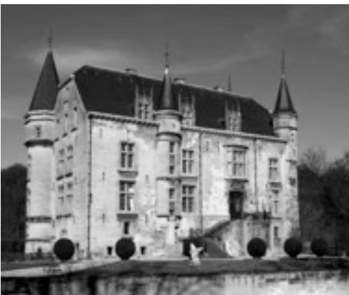
Kasteel Schaloen Valkenburg

De C-rit volgt het heuvelend landschap van de streek en passeert eveneens de mooie dorpjes maar mijdt de stijle kuitenbijters die deze streek berucht maakt.